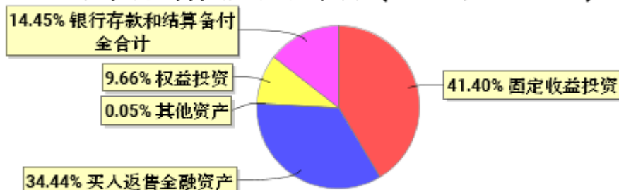
投资组合资产配置图表(2024年9月30日)

● 固定收益投资 ● 买入返售金融资产 ● 其他资产 ● 权益投资 ● 银行存款和结算备付金合计