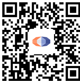
国泰君安资管 APP 下载二维码

投资者可以在应用市场搜索“国泰君安资管”，或者扫描下方二维码，下载国泰君安资管 APP，了解基金产品、服务等信息。