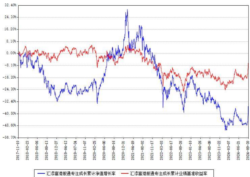
汇添富港股通专注成长累计净值增长率与同期业绩基准收益率对比图