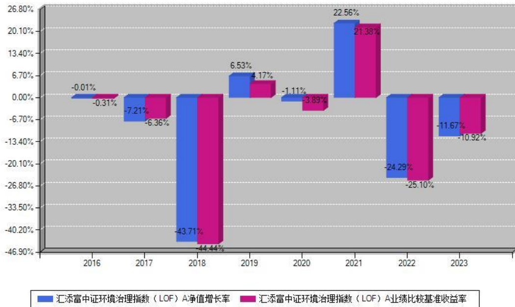
汇添富中证环境治理指数 (LOF) A 每年净值增长率与同期业绩基准收益率对比图

注：数据截止日期为2023年12月31日，基金的过往业绩不代表未来表现。本《基金合同》生效之日为2016年12月29日，合同生效当年按实际存续期计算，不按整个自然年度进行折算。