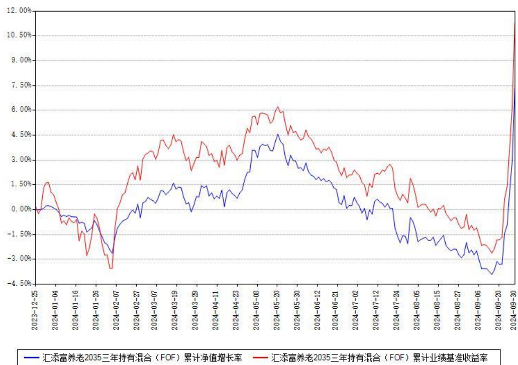
汇添富养老2035三年持有混合（FOF）累计净值增长率与同期业绩基准收益率对比图