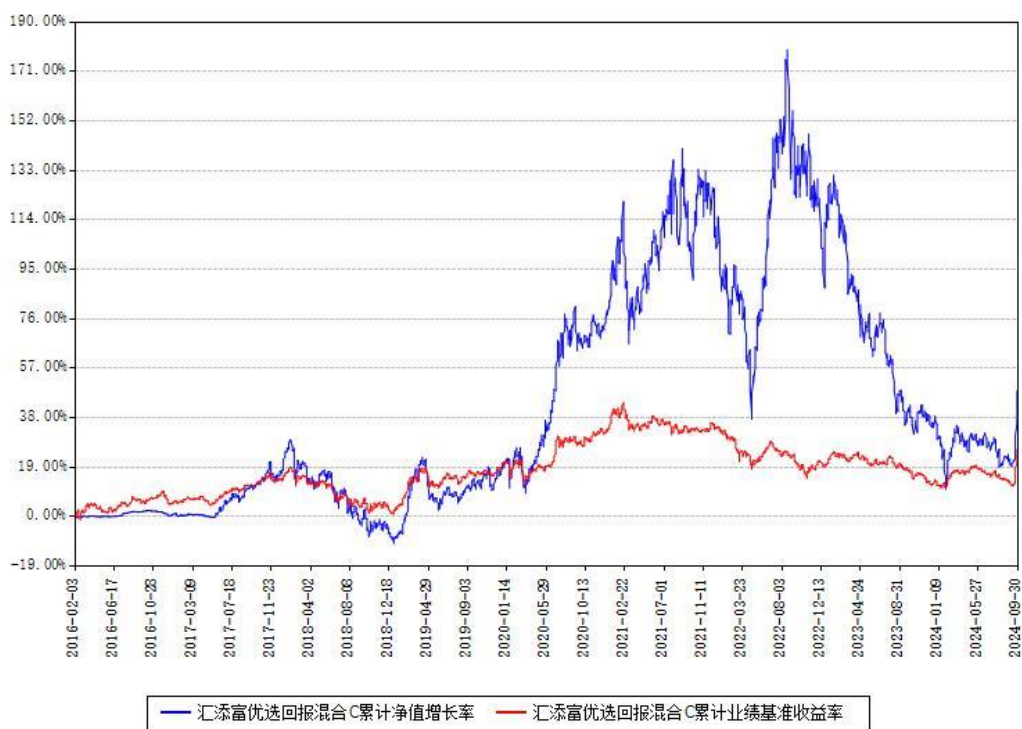
汇添富优选回报混合C累计净值增长率与同期业绩基准收益率对比图