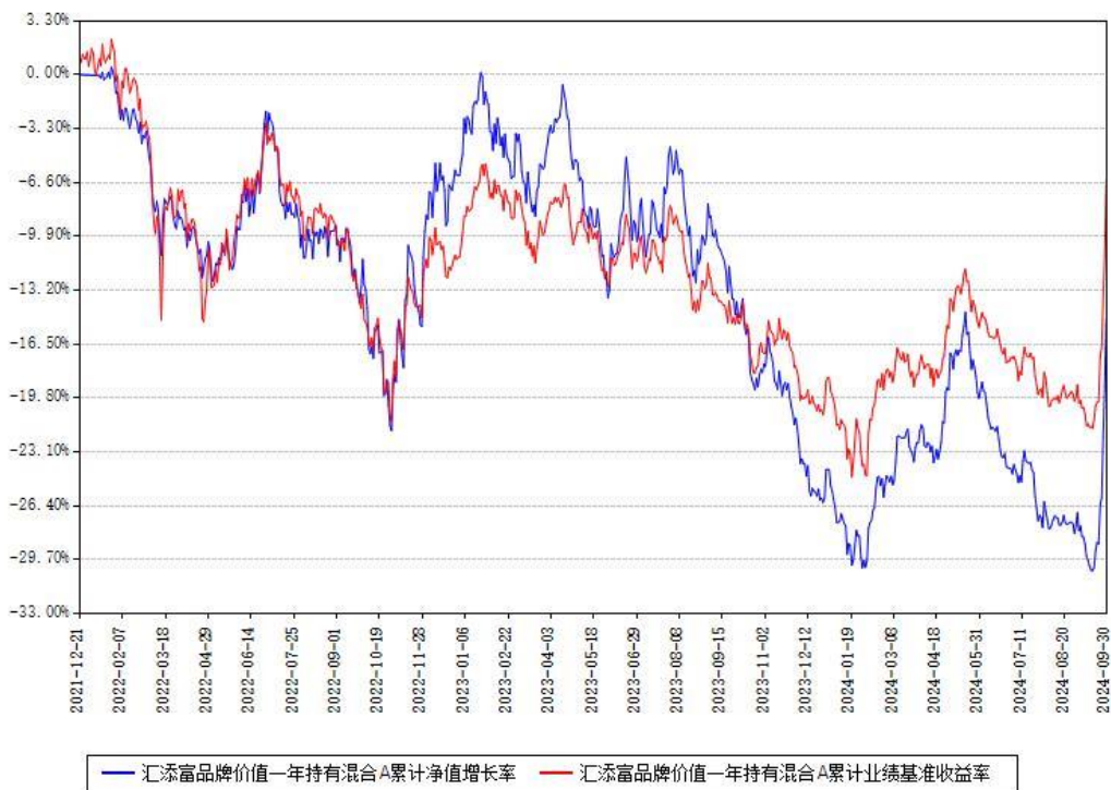
汇添富品牌价值一年持有混合A累计净值增长率与同期业绩基准收益率对比图

(二) 自基金合同生效以来基金累计净值增长率变动及其与同期业绩比较基准收益率变动的比较