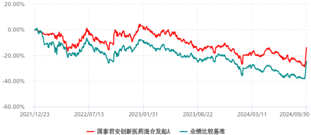
国泰君安创新医药混合发起A累计净值增长率与业绩比较基准收益率历史走势对比图 (2021年12月23日-2024年09月30日)