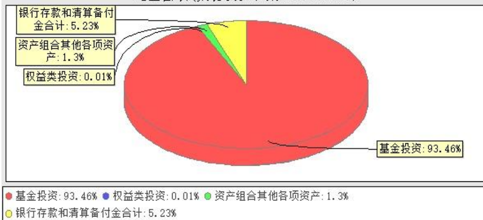
华宝中证科技龙头交易型开放式指数证券投资基金发起式联接基金投资组合资产配置图表(数据截止日期: 20240930)