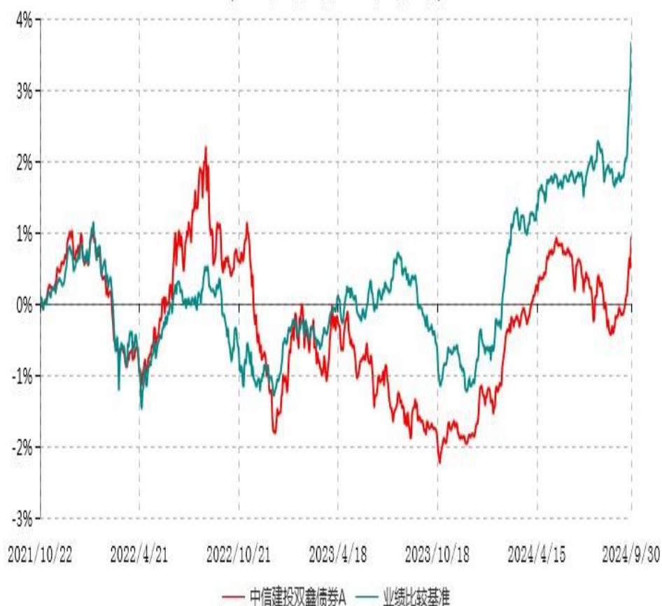
中信建投双鑫债券A累计净值增长率与业绩比较基准收益率历史走势对比图 (2021年10月22日-2024年09月30日)