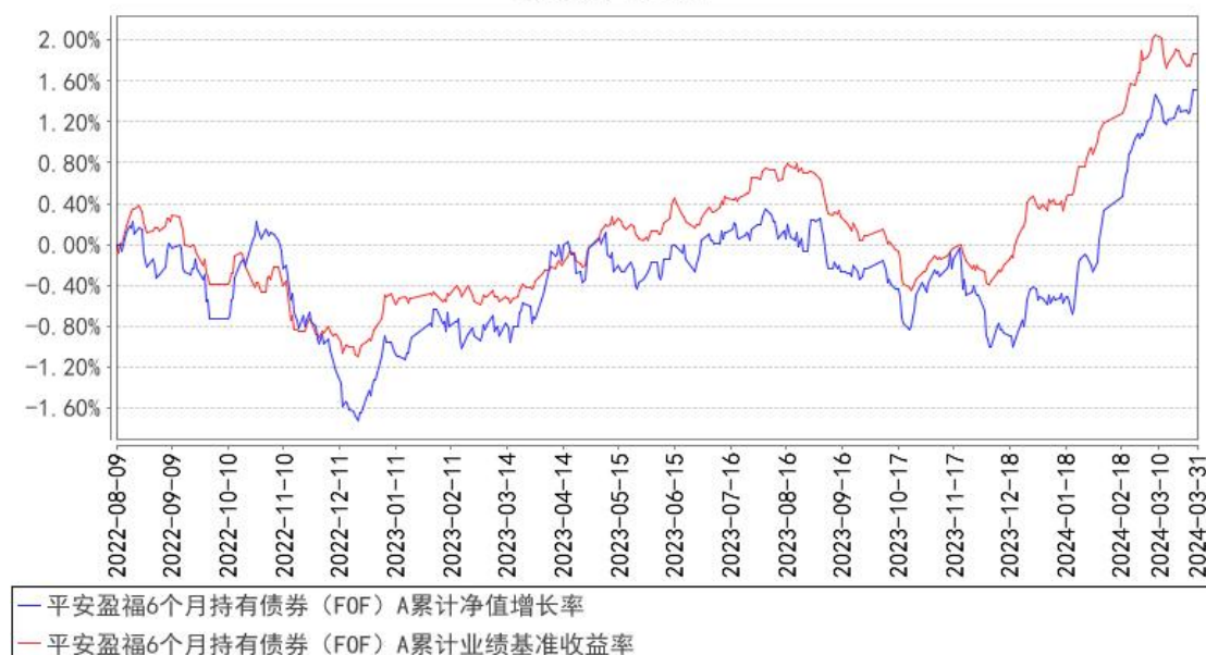
平安盈福6个月持有债券（FOF）A累计净值增长率与同期业绩比较基准收益率的历史走势对比图