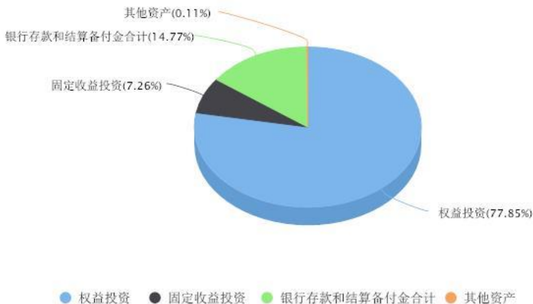
投资组合资产配置图表 数据截止日期:2024年03月31日