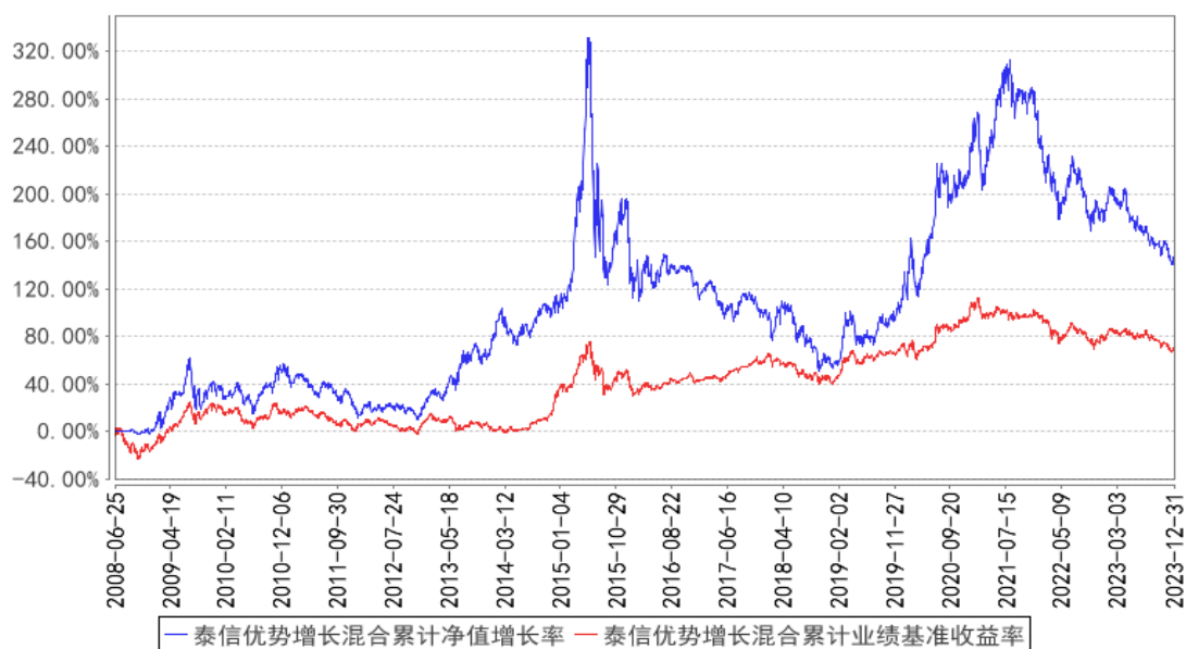
泰信优势增长混合累计净值增长率与同期业绩比较基准收益率的历史走势对比图