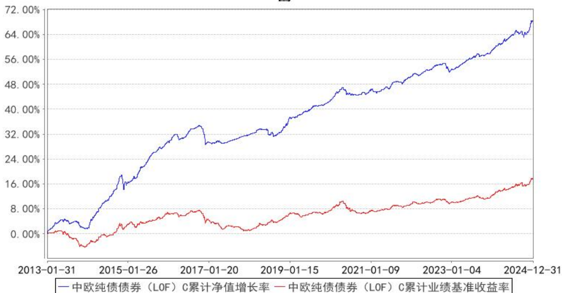
中欧纯债债券（LOF）C 累计净值增长率与同期业绩比较基准收益率的历史走势对比图