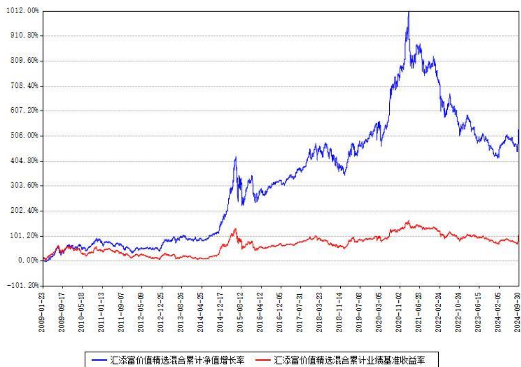
汇添富价值精选混合累计净值增长率与同期业绩基准收益率对比图

（二）自基金合同生效以来基金累计净值增长率变动及其与同期业绩比较基准收益率变动的比较图