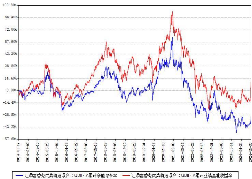
汇添富香港优势精选混合（QDII）A累计净值增长率与同期业绩基准收益率对比图