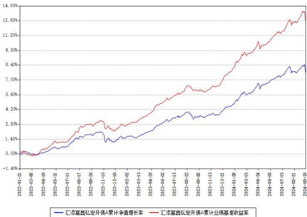
汇添富鑫弘定开债A累计净值增长率与同期业绩基准收益率对比图