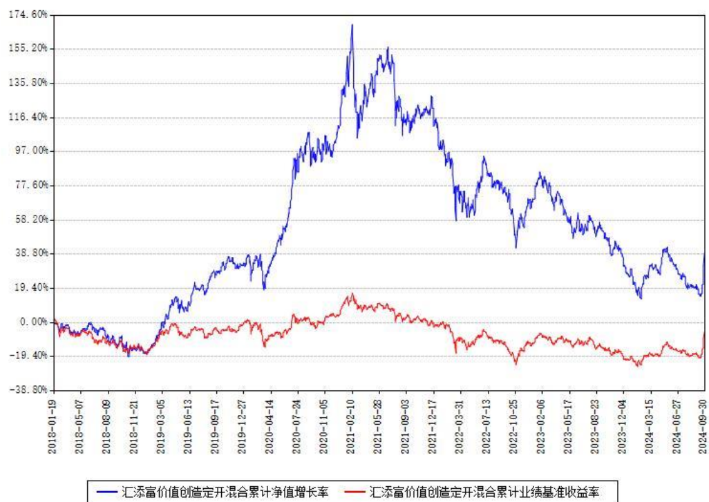
汇添富价值创造定开混合累计净值增长率与同期业绩基准收益率对比图