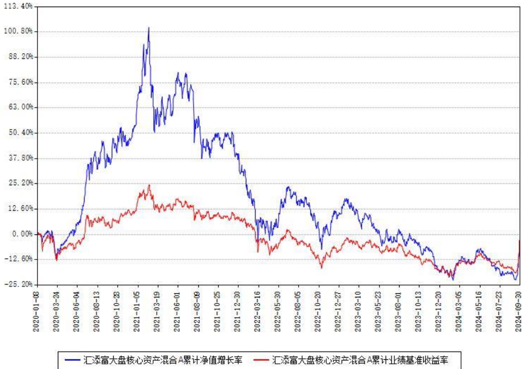
汇添富大盘核心资产混合A累计净值增长率与同期业绩基准收益率对比图

(二)自基金合同生效以来基金累计净值增长率变动及其与同期业绩比较基准收益率变动的比较图