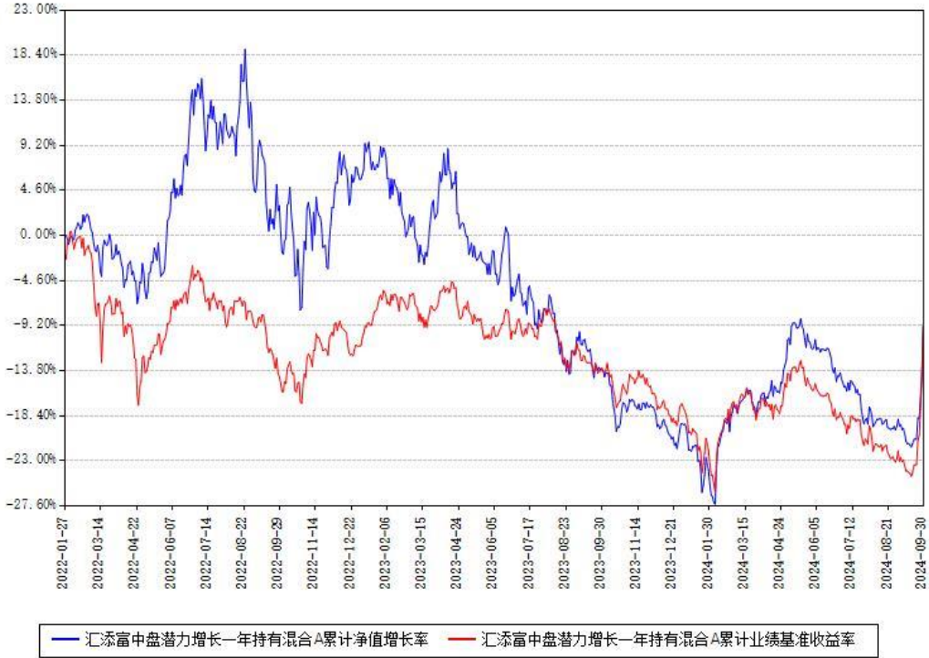
汇添富中盘潜力增长一年持有混合A累计净值增长率与同期业绩基准收益率对比图