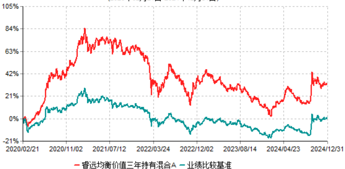
睿远均衡价值三年持有混合A累计净值增长率与业绩比较基准收益率历史走势对比图 (2020年02月21日-2024年12月31日)