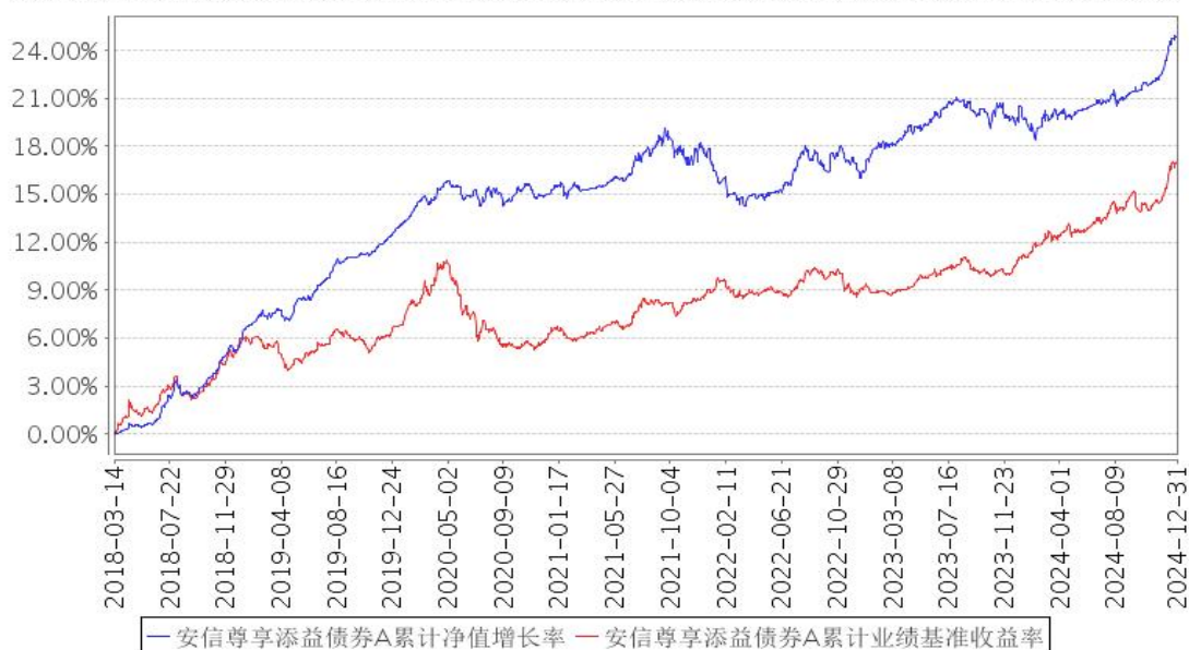
安信尊享添益债券A累计净值增长率与同期业绩比较基准收益率的历史走势对比图