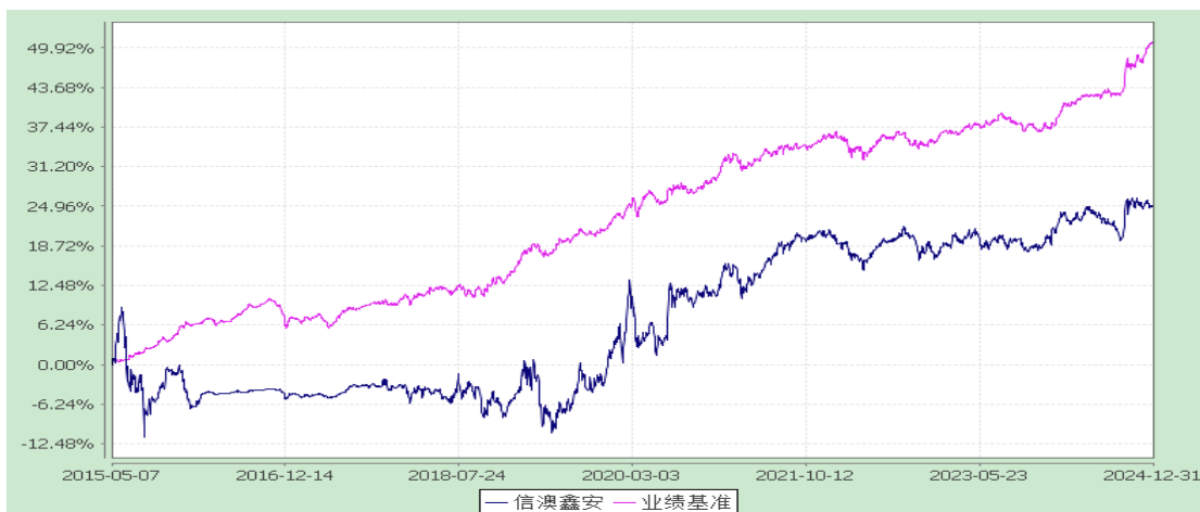
信澳鑫安债券 C 累计净值增长率与业绩比较基准收益率的历史走势对比图