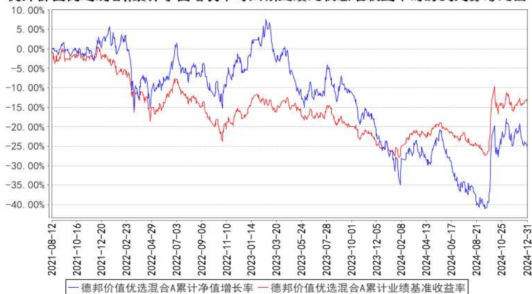
德邦价值优选混合A累计净值增长率与同期业绩比较基准收益率的历史走势对比图