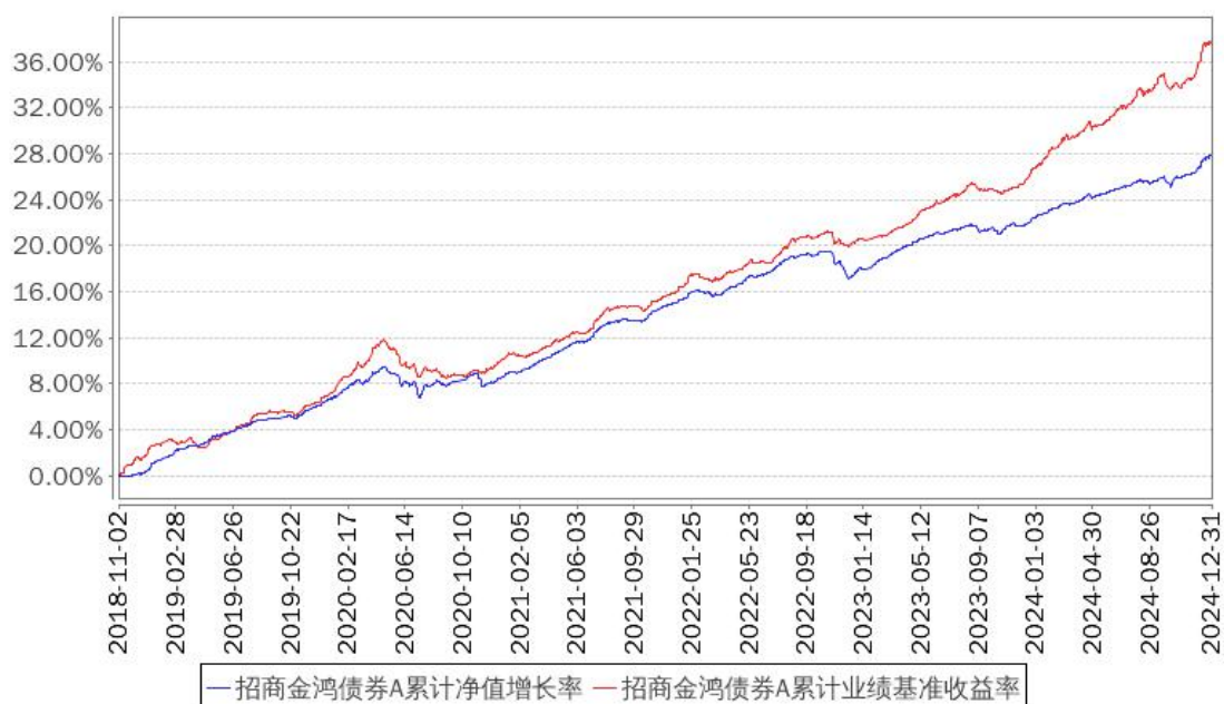
招商金鸿债券A累计净值增长率与同期业绩比较基准收益率的历史走势对比图