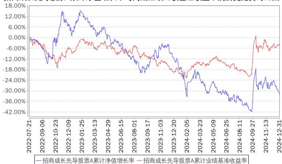
招商成长先导股票A累计净值增长率与同期业绩比较基准收益率的历史走势对比图