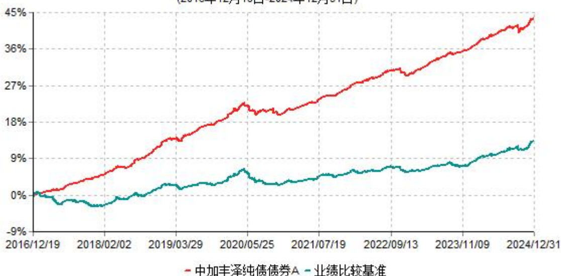
中加丰泽纯债债券A累计净值增长率与业绩比较基准收益率历史走势对比图 (2016年12月19日-2024年12月31日)