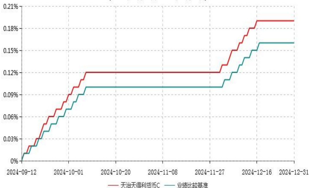
天治天得利货币C累计净值收益率与业绩比较基准收益率历史走势对比图 (2024年09月12日-2024年12月31日)

注：本基金自2024年9月10日起新增C类基金份额。2024年10月10日至2024年12月1日、2024年12月18日至2024年12月31日该类基金份额为零，对应区间累计净值收益率及业绩比较基准不变。