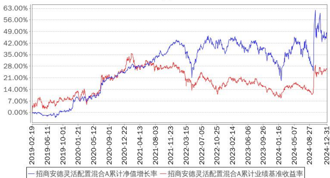
招商安德灵活配置混合A累计净值增长率与同期业绩比较基准收益率的历史走势对比图