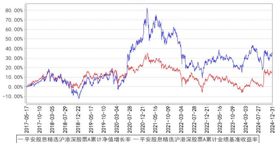
平安股息精选沪港深股票A累计净值增长率与同期业绩比较基准收益率的历史走势图