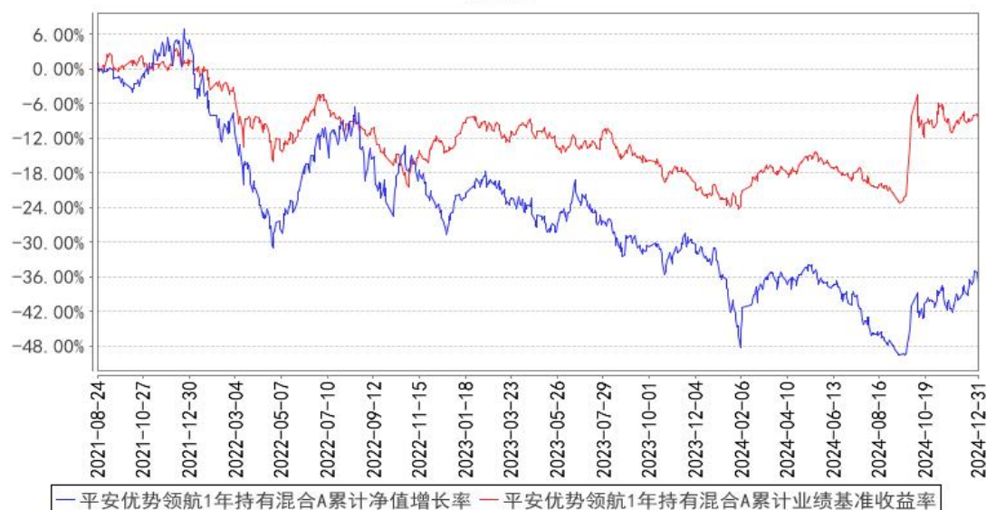
平安优势领航1年持有混合A累计净值增长率与同期业绩比较基准收益率的历史走势对比图