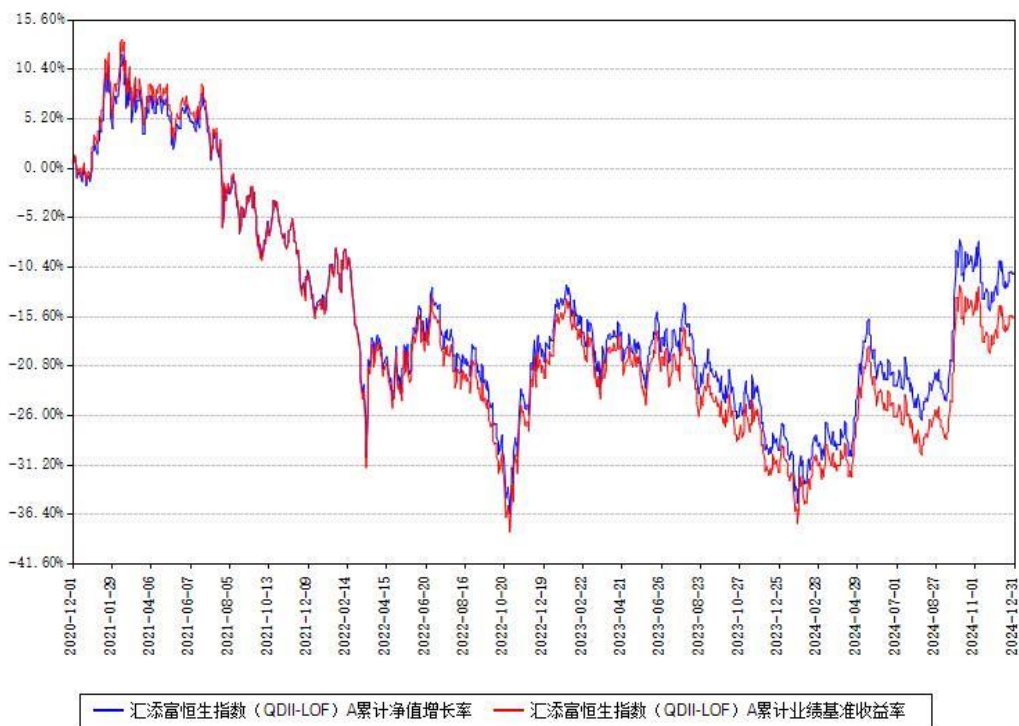
汇添富恒生指数（QDII-LOF）A累计净值增长率与同期业绩基准收益率对比图