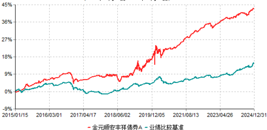
金元顺安丰祥债券A累计净值增长率与业绩比较基准收益率历史走势对比图 (2015年01月14日-2024年12月31日)