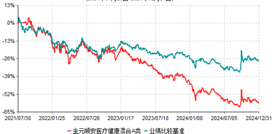
金元顺安医疗健康混合A类累计净值增长率与业绩比较基准收益率历史走势对比图 (2021年07月29日-2024年12月31日)