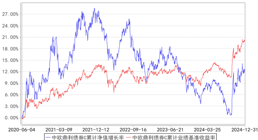
中欧鼎利债券C累计净值增长率与同期业绩比较基准收益率的历史走势对比图

注：自 2020 年 6 月 3 日起，本基金增加 C 类份额。同日起，本基金业绩比较基准由“中国债券总值指数收益率*90%+沪深 300 指数收益率*10%”变更为“中证 800 指数收益率*15%+中证可转换债券指数*25%+中债综合财富指数收益率*60%”。图示日期为 2020 年 6 月 4 日至 2024 年 12 月 31 日。