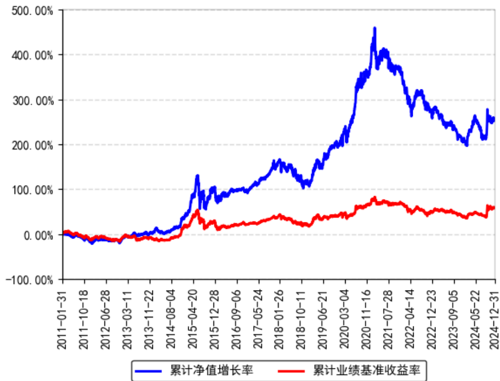
南方优选成长混合A累计净值增长率与同期业绩比较基准收益率的历史走势对比图