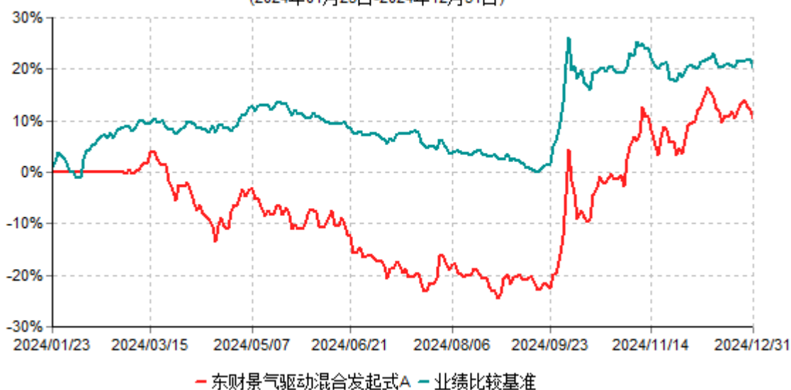
东财景气驱动混合发起式A累计净值增长率与业绩比较基准收益率历史走势对比图 (2024年01月23日-2024年12月31日)