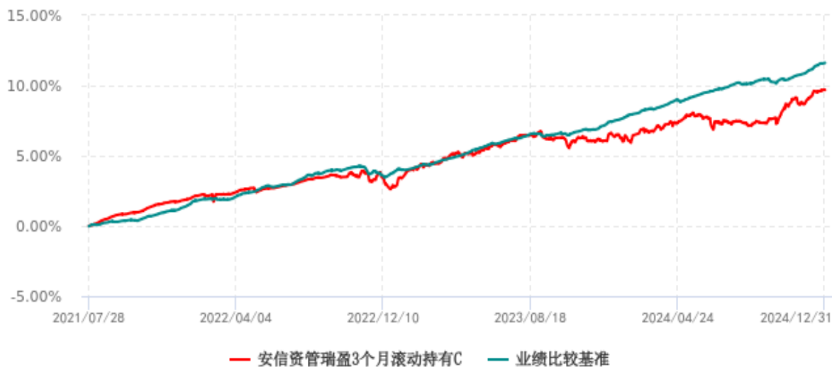
安信资管瑞盈3个月滚动持有C累计净值增长率与业绩比较基准收益率历史走势对比图 (2021年07月28日-2024年12月31日)

注: 安信瑞盈 3 个月滚动持有债券 C (970060) 2021 年 7 月 23 日尚未开放申赎, 无计划份额, 2021 年 7 月 23 日净值不进行披露。