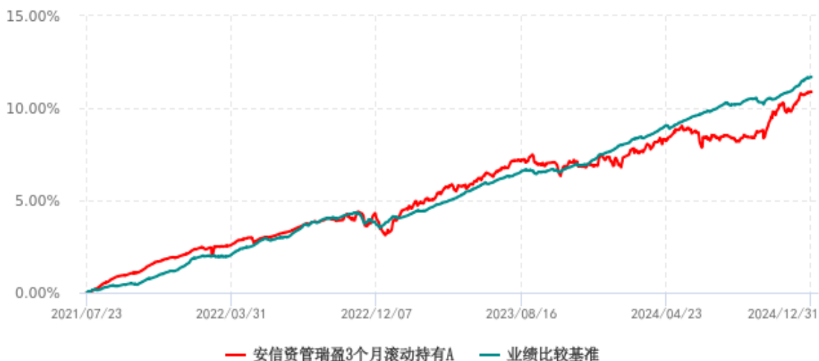
安信资管瑞盈3个月滚动持有A累计净值增长率与业绩比较基准收益率历史走势对比图 (2021年07月23日-2024年12月31日)