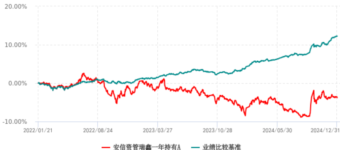
安信资管瑞鑫一年持有A累计净值增长率与业绩比较基准收益率历史走势对比图 (2022年01月21日-2024年12月31日)