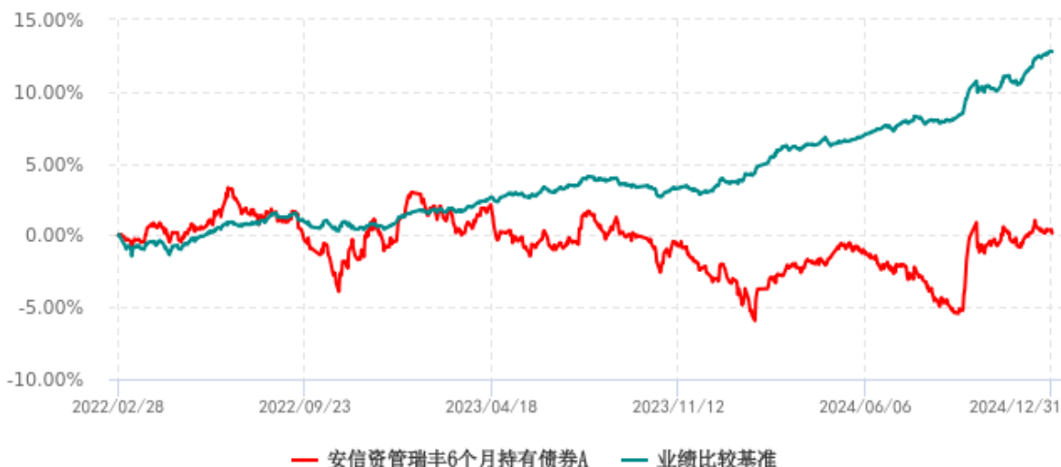
安信资管瑞丰6个月持有债券A累计净值增长率与业绩比较基准收益率历史走势对比图 (2022年02月28日-2024年12月31日)