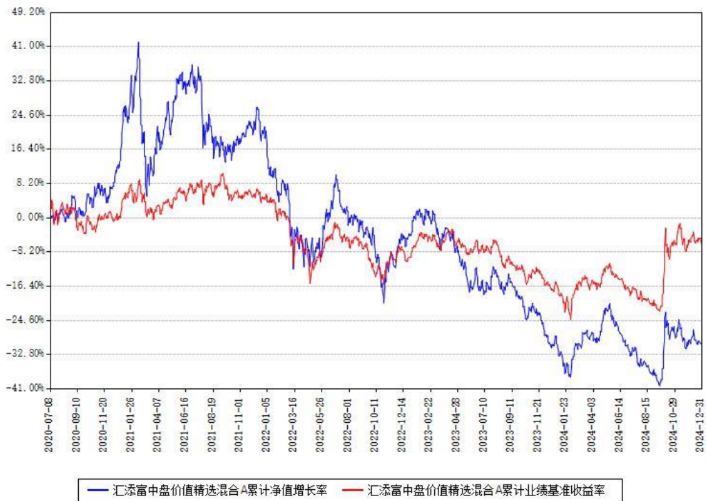
汇添富中盘价值精选混合A累计净值增长率与同期业绩比较基准收益率对比图