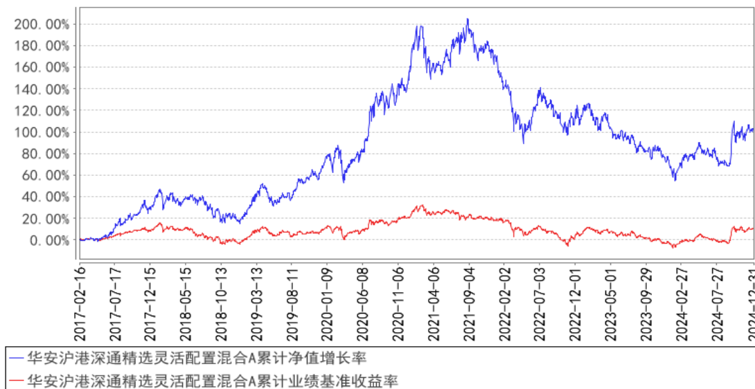
华安沪港深通精选灵活配置混合A累计净值增长率与同期业绩比较基准收益率的历史走势对比图