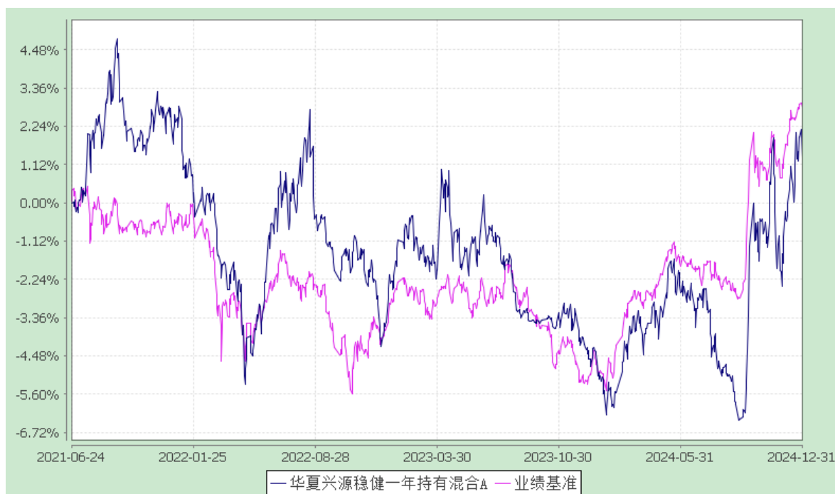
华夏兴源稳健一年持有混合 C: