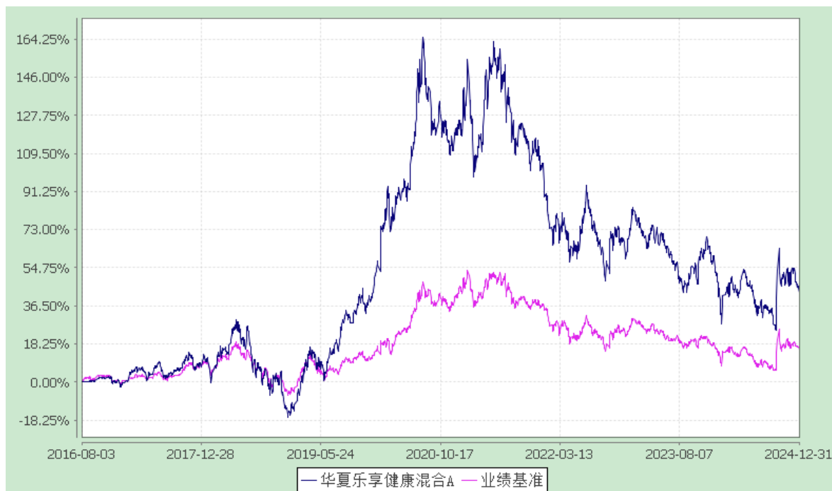
华夏乐享健康混合 C: