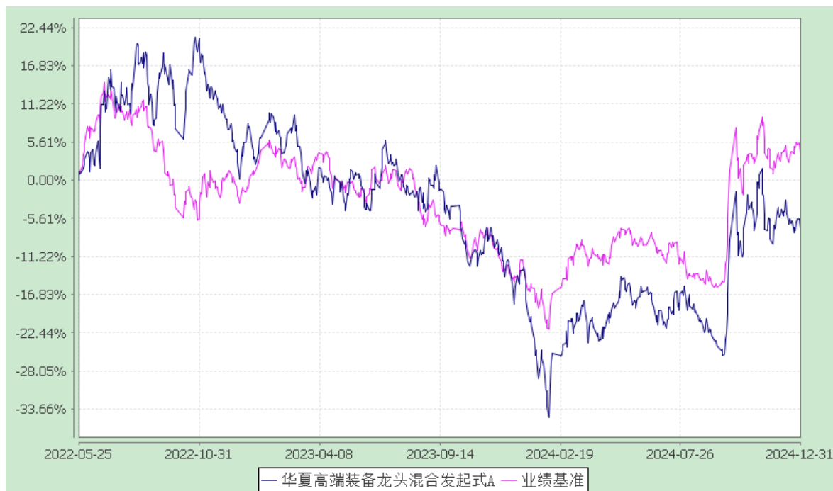
华夏高端装备龙头混合发起式 C: