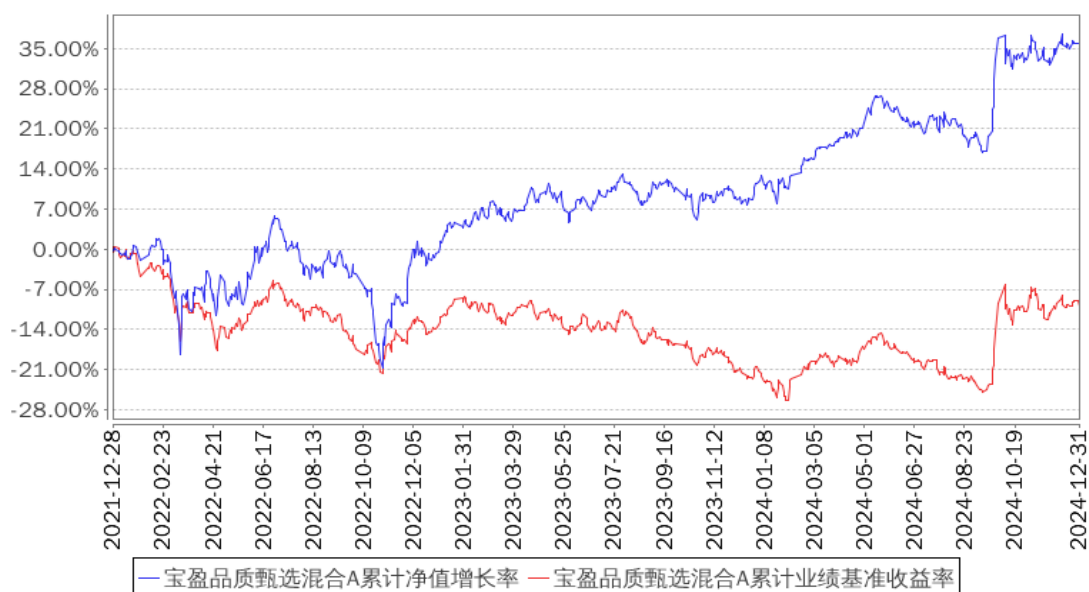
宝盈品质甄选混合A累计净值增长率与同期业绩比较基准收益率的历史走势对比图