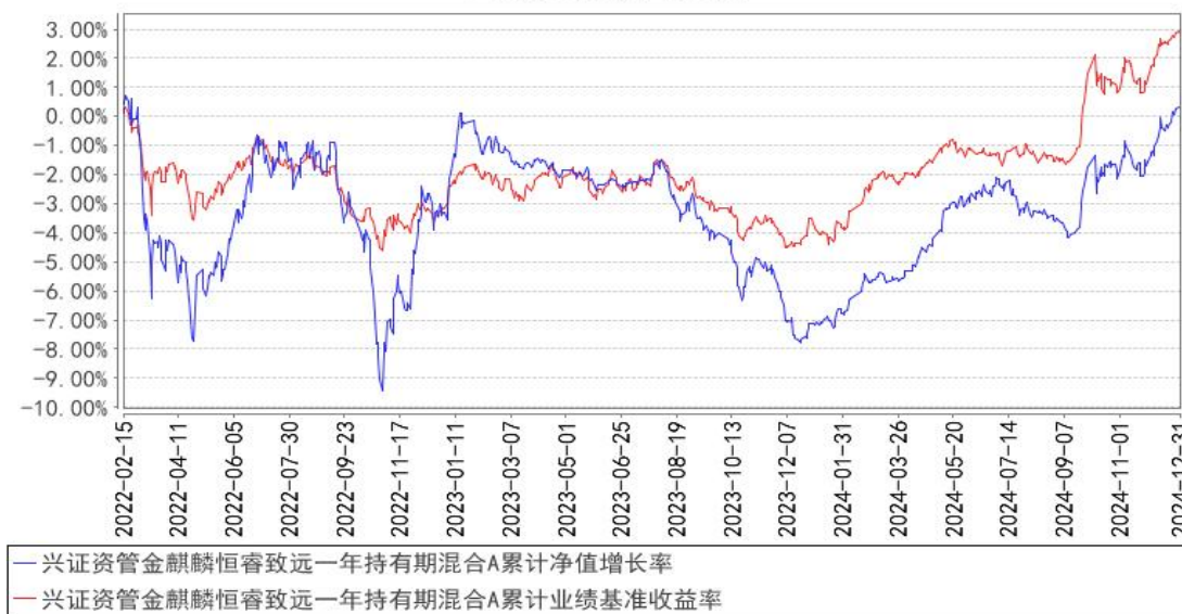
兴证资管金麒麟恒睿致远一年持有期混合A累计净值增长率与同期业绩比较基准收益率的历史走势对比图