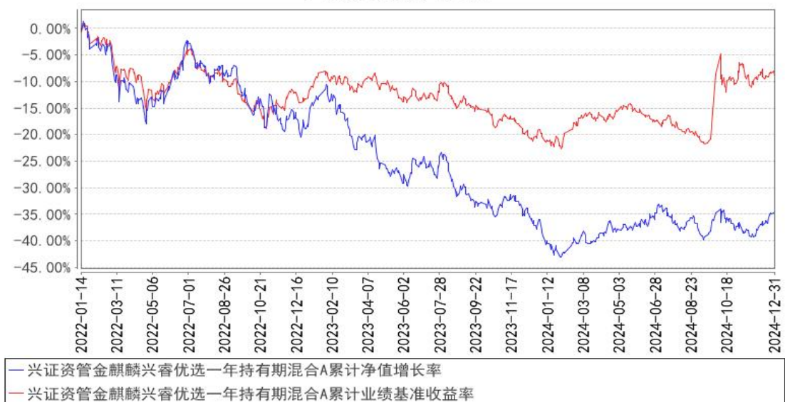
兴证资管金麒麟兴睿优选一年持有期混合A累计净值增长率与同期业绩比较基准收益率的历史走势对比图