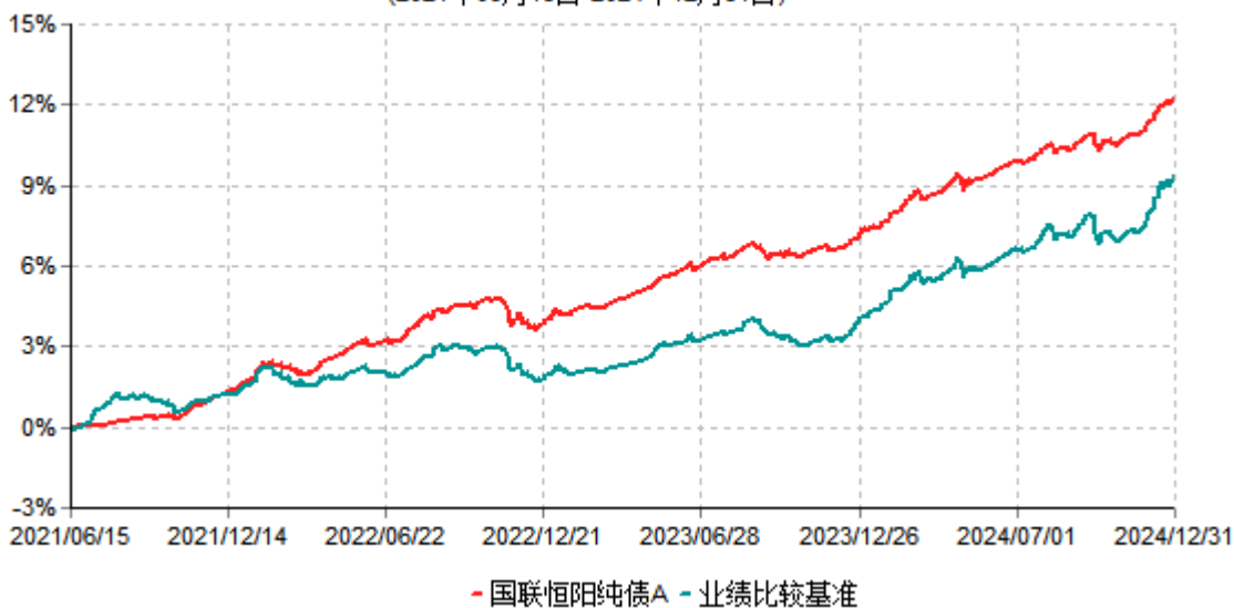
国联恒阳纯债A累计净值增长率与业绩比较基准收益率历史走势对比图 (2021年06月15日-2024年12月31日)