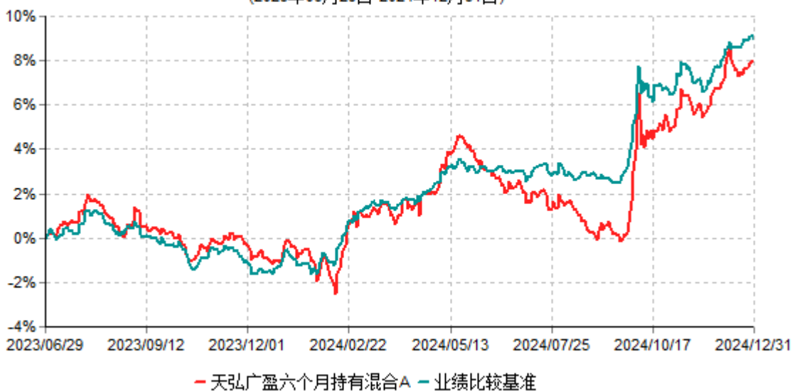
天弘广盈六个月持有混合A累计净值增长率与业绩比较基准收益率历史走势对比图 (2023年06月29日-2024年12月31日)